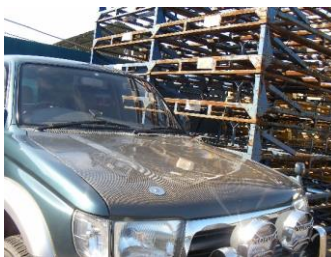
カーボン製ボンネット