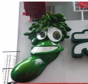
FRP製看板用レリーフ