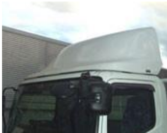
FRP 製トラック用導風板

FRPは他プラスチック成型品より「設備投資額が少ない」「少量・多品種生産が可能」「軽くて丈夫」「耐熱・耐薬品等への対応性」の利点で、様々な分野で利用されています。以下、当社製品をご案内します。